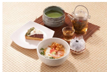
大人のための小さなオアシスと親しまれている —神楽坂発の癒し系和カフェ「神楽坂 saryō」