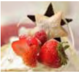
オーダーケーキ例：お好きなオーダーメントもお持ちいただけます。

今年も定番のクリスマスケーキ以外に、数量限定の完全オーダークリスマスケーキを発売。ご要望詳細をお聞きし、ご希望の形・素材・デコレーションも思いのまま。まさに『世界でたったひとつのMyクリスマスケーキ』をご提供します。