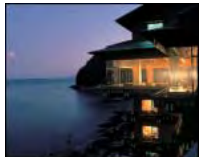
伊豆 北川温泉「望水」